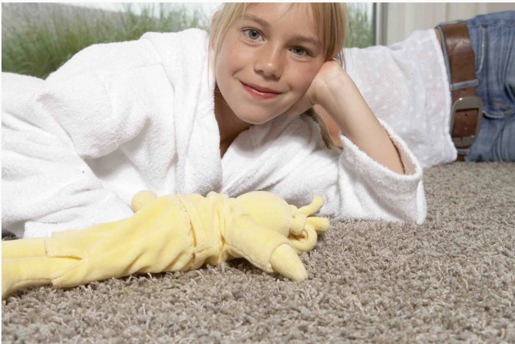
LANO « Impala 850 »

Relaxation musculaire : du point de vue orthopédique, les moquettes sont de loin les meilleurs revêtements de sols.