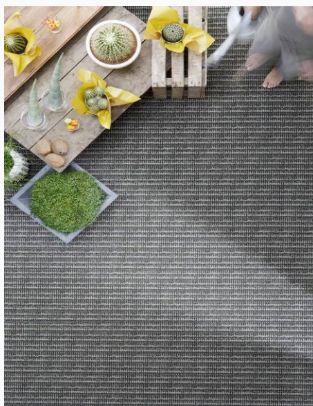
BALSAN « Jute Cedre 750 »