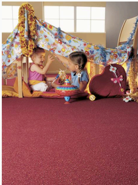
B.I.G. « Treviso 440 mannequin »

Les acariens sont avant tout dans la literie. Le mot-clé pour lutter contre les allergies respiratoires, c'est la ventilation du bâtiment.