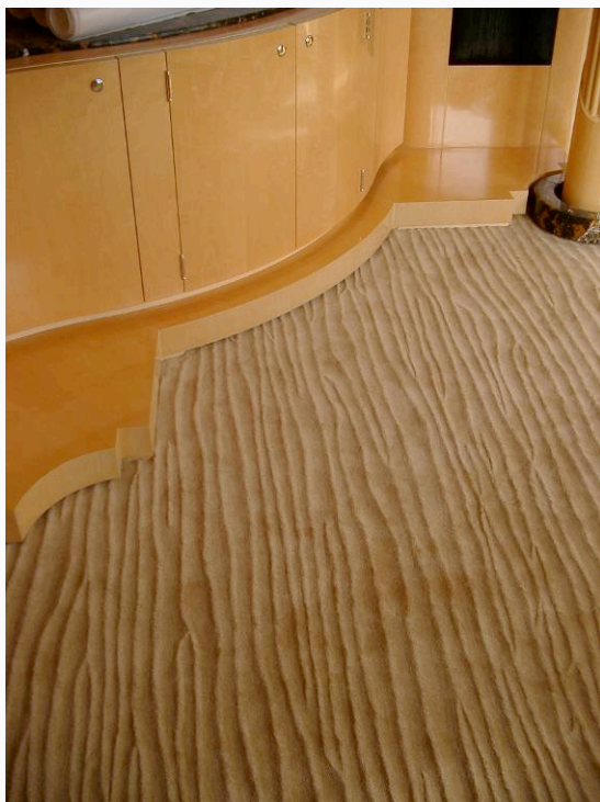
TAI PING « sea jewel »

L'aspirateur à brosses contribue également à restituer sa belle apparence à la moquette en redressant les fibres.