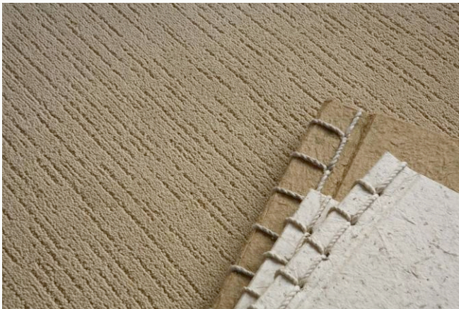
BALSAN « Écorce daim »