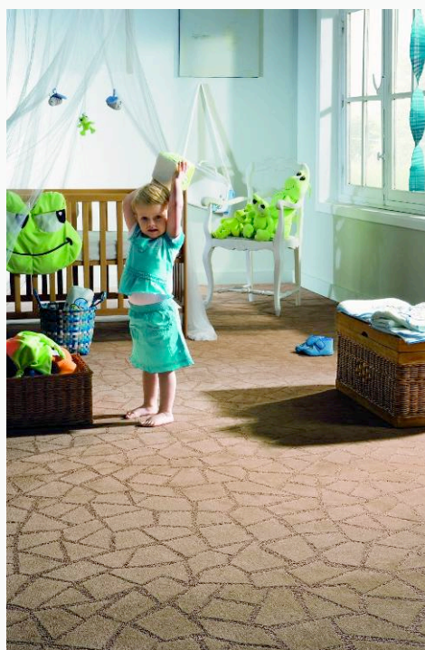
BALTA « Décor mosaïque »