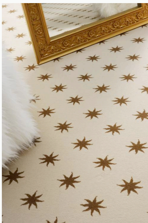
BALSAN « Sun neige »

Depuis plusieurs années une phobie collective s'est installée autour des acariens domestiques. L'acarien est devenu le monstre à la mode qu'il faudrait éliminer à tout prix. Pour 800 000 personnes sujettes à des crises d'asthme d'origine domestique, 59 200 000 personnes n'ont rien à craindre des acariens. Les mesures d'économie d'énergie nous ont amené à isoler et calfeutrer les habitations. L'on n'ose plus ouvrir les fenêtres pour aérer. Les tapis, les matelas et les couettes sont également rarement secoués.