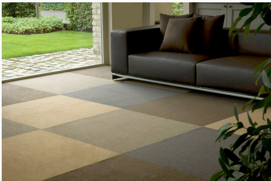
DOMO CONTRACT « Cambridge 1 »

Certaines personnes ont une réaction allergique aux composants de la poussière qu'elles respirent : la moquette retient la poussière au sol contrairement aux autres revêtements de sols où la poussière reste en suspension dans l'air ! il vous suffira de passer l'aspirateur pour enlever les poussières.