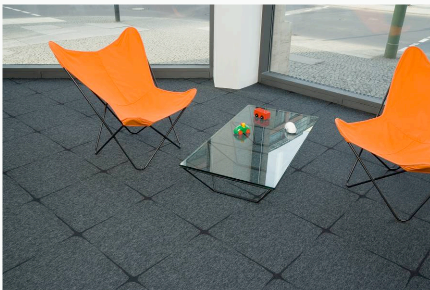
INTERFACE « Network 3 - 5992 »