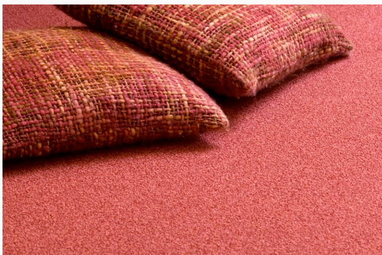
DOMO CONTRACT « Firenze 316- 2 »

Il faut savoir que la moquette n'est pas le repère favori des acariens, ils se nourrissent des déchets de peau et se complaisent dans une atmosphère chaude et humide. Le lit resterait l'endroit le plus propice à ces conditions de vie pour les acariens.