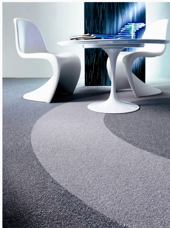
ENIA « Salle d'attente »

Aucune étude en situation réelle n'a prouvé l'efficacité du retrait de la moquette : les acariens domestiques vivent de la présence de l'homme et préfèrent les atmosphères chaudes et humides qui accélèrent leur croissance et favorisent leur multiplication.