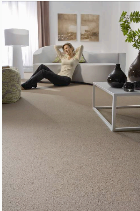
BALTA « Stain safe living »